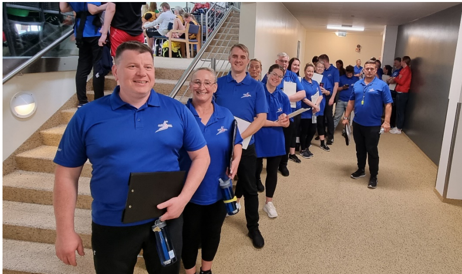
Dómarar á AMÍ í Vatnaveröld júní 2022

AMÍ í Vatnaveröld, Reykjanesbær 24. – 26. júní