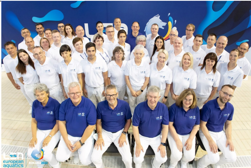
Dómarar á EMU í Búkarest, Rúmeníu í júlí 2022.