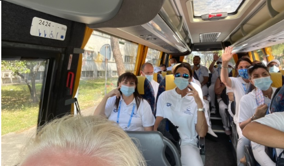
Á leið á mótstað – allir með grímu og strangar sóttvarnir á Ítalíu á þessum tíma.

EM 25 í Kazan, Rússlandi, 2. – 7. nóvember 2021