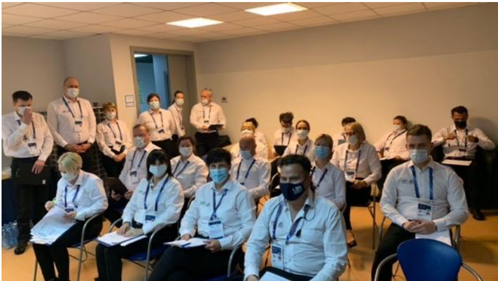
Dómarafundur fyrir mótshluta á EM 25 í Kazan, Rússlandi.